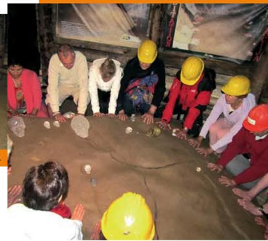
Méditation au mégalithe K2.

En 2007 des tunnels souterrains ont été détectés par des géophysiciens allemands sous le tumulus grâce à un scan géo-radar. En 2009, des sondages géologiques faits par carottage au sommet du tumulus ont donné les résultats suivants :