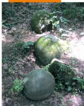
Boules de Pierre de Bosnie.

L'existence des boules de pierre dans cette région de Bosnie est restée inconnue avant qu'un tremblement de terre ne les révèle il y a 12 ou 13 ans.