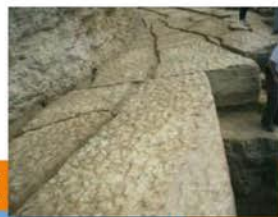
Blocs de construction du tumulus.