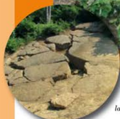
Plaques de béton de la pyramide du Soleil.