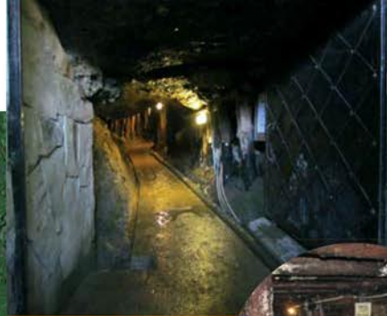
Entrée du Tunnel Ravne