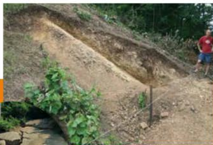
Angle nord de la pyramide du Soleil.