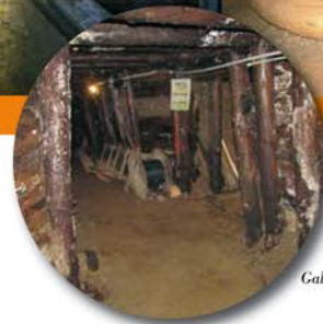
Galerie du Tunnel Ravne.