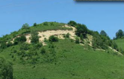
Le tumulus de Vratnica.