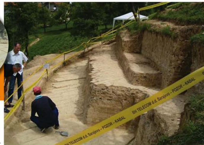
Terrasse de la pyramide de la Lune.