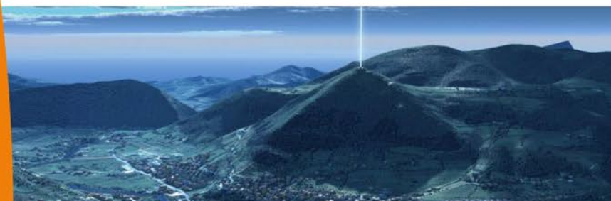
Représentation du rayon d'énergie sur la pyramide du Soleil.